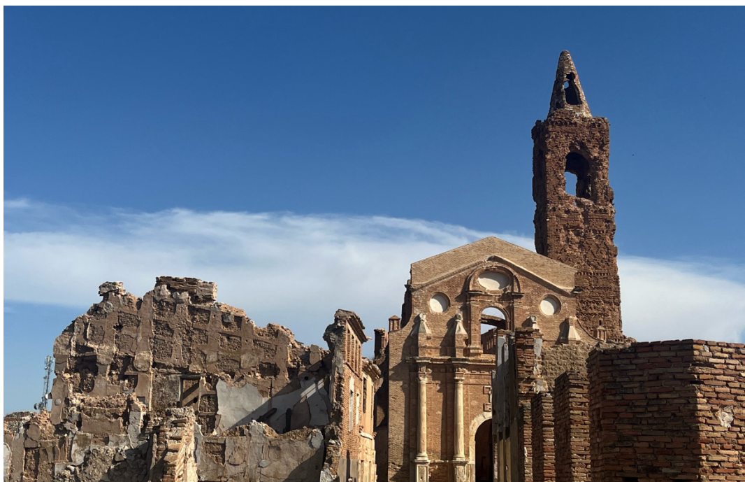
Belchite viejo, 2025