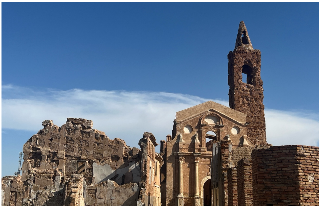
Belchite viejo, 2025